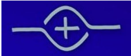
Symbol Kirche „Bonner Franziskus-Tuch“

Herr, bringe deine Liebe und Wahrheit zu allen Menschen und fange bei mir an.