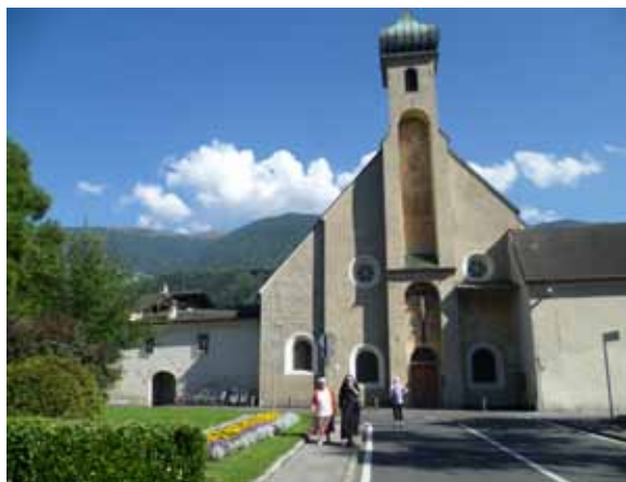
Elisabeth-Kirche der Klarissen

Im Garten hinter dem Haus, weil es gerade in diesen Tagen sehr heiß war, errichteten wir die „franziskanische Genussmeile“ für das Mittagessen, das einfach, gut und ausreichend war.