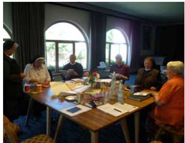
Vorstandssitzung in Brixen