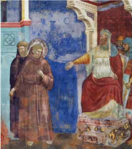
Giotto: Franziskus beim Sultan