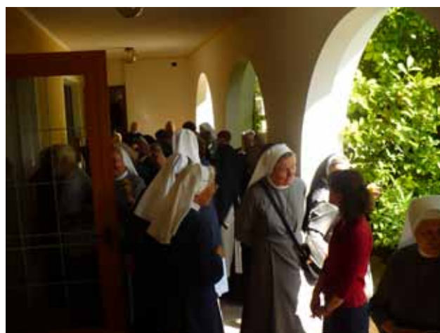
Pause im Garten