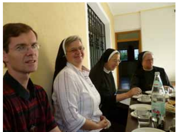
Vorstandssitzung in Brixen