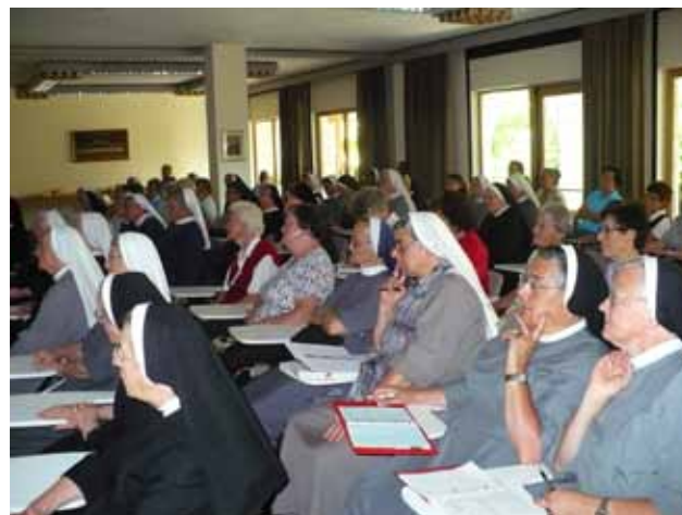
Teilnehmer des Klaratages