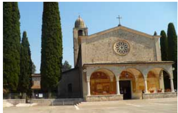
Wallfahrtskirche Madonna del Frassinio

Um 14.00 Uhr trafen wir uns in der alten Pfarrkirche, wo Giuseppe Roncalli getauft wurde und die Primizmesse gefeiert hat. Dort konnten wir auch die Vorderseite des Sarkophags aus den vatikanischen Grotten finden in dem der Papst bis zu Seligsprechung beigesetzt war.