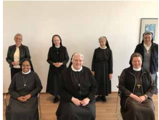
Teilnehmerinnen des 2. Workshops